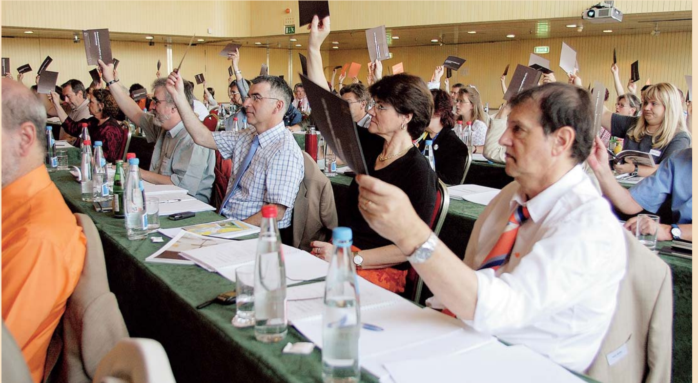
Je vielfältiger BILDUNG SCHWEIZ die Lehrerschaft kommunikativ vernetzt, umso vifer, weltgesättigter, zukunftsvergnügter, attraktiver wird die Lehrerin», sagt Ludwig Hasler. Im Bild: Verbandsdemokratie an der LCH-Delegiertenversammlung 2006 in Zürich.

Textsorten, stets zur Diskussion aufbereitet, nicht als Indoktrination verabreicht.